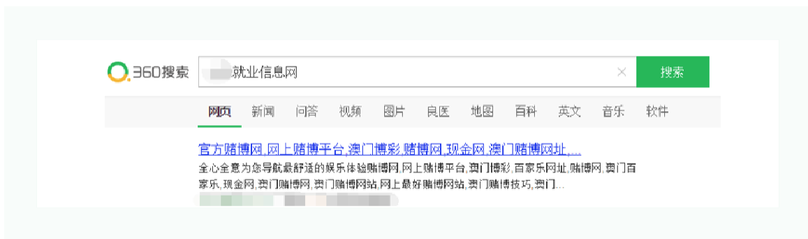
图1 网站被黑导致标题摘要被篡改