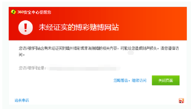
图2 访问被黑站点时被提示风险